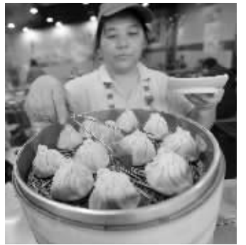
包顺兴小笼包

老店新开后,包顺兴小笼包依然是店内的明星产品。哈翔介绍,他家的小笼包出24个明细褶皱,留一小洞,似鲫鱼嘴,具有个小皮薄、馅多肉嫩、卤汁丰富、咸中带甜、丰腴润滑的特点。