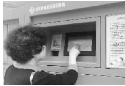
居民正在刷卡扔垃圾

秦淮区城管局垃圾分类办公室相关人员介绍,秦淮区在佳日雅苑、水秀苑、儒林雅苑等20多个小区内投放了智能回收箱。回收箱的运营公司相关负责人刘先生介绍,居民投放20斤废旧报纸、400个矿泉水瓶子,就能积