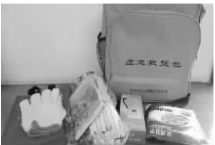
应急救援包

一政府采购,发放对象由各区分人防办在本辖区家庭中(历年通过摇号已领取应急救援包的除外)通过摇号方式随机确定。为确保公正,各区在组织摇号时都有纪检监察部门和公证部门等监督。摇号结果通过区政府网站、街道和社区公示栏进行公示。“城郊五区”和化工园区发放形式参照主城区执行。