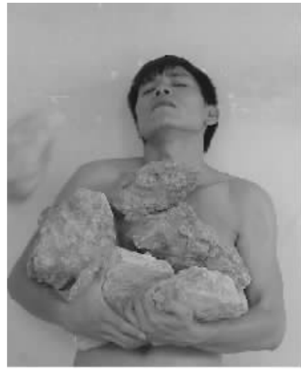
何利校《星期天》行为(局部)