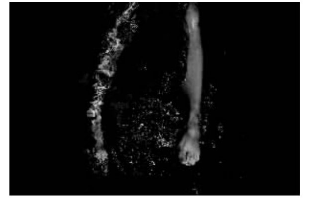
jose durummod《the ghost》摄影