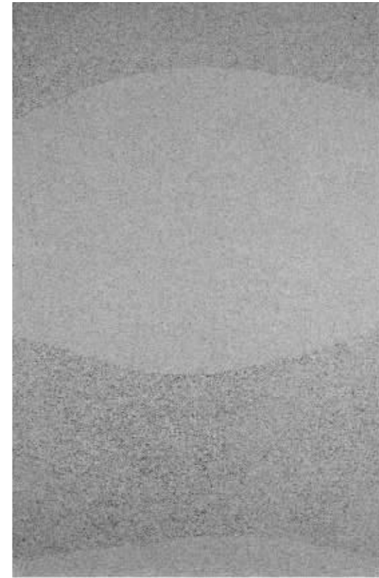
周钦珊《宣言No.200804》综合材料