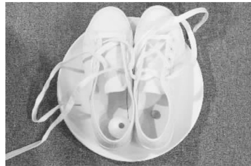
吴天然《自恋的弗尼辛》装置(局部)