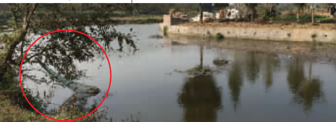
娃娃鱼就是钻进红圈处的渔网被发现的