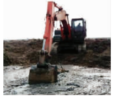
挖掘机开到对岸,伸长臂爪,抓斗轻轻包住泥潭里的麋鹿,慢慢往岸上靠