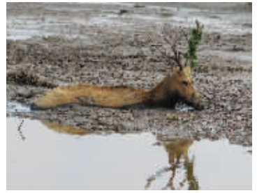
麋鹿挣扎,却越陷越深