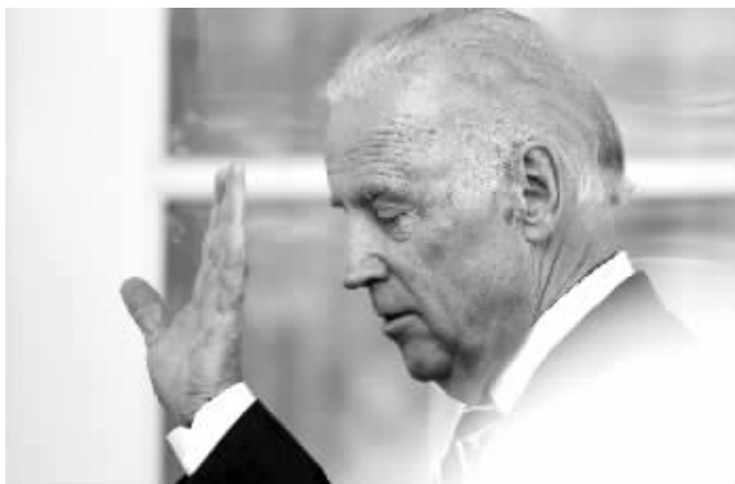
希拉里(左)、拜登(右)

美国副总统约瑟夫·拜登21日宣布不参加2016年美国总统选举，由此终结几个月来外界关于他将第三次角逐白宫的猜测，为前国务卿希拉里·克林顿赢得民主党提名移除了一大障碍。希拉里因此感到“鼓舞”，共和党方面则松了一口气，但是也有些失望。