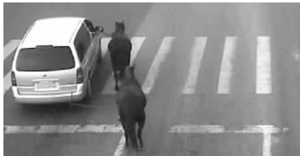
监控记录下了车拉马的一幕

马车是古代常见的交通工具,随着汽车的普及,马拉车退出了历史舞台,近日镇江扬中市却出现了车拉马的场景——一辆别克商务车拖着两匹马在路上行驶,紧随其后的4辆轿车只能缓慢跟行。据镇江扬中交警大队介绍,10月19日下午4点43分许,扬中交警大队城区中队接到市民报警称,在滨江大道上有一辆别克商务车拖着两匹马在路上奔跑。民警赶到现场后并没有看到这个场景。