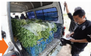
装车运往市场

说起八卦洲的芦蒿,那是鼎鼎有名,不仅供给南京本地的市场,还远销南昌、杭州等城市。近日,现代快报记者来到了八卦洲东江村二组,路边的田地里整齐地种着一排排的芦蒿,长势正好,还有农民正把收割好的芦蒿扎成捆,运往市场。村民老林告诉记者,“今年的芦蒿才刚刚出来,因为温度条件不错,芦蒿的品质很好。一亩地正常能产个几千斤芦蒿,每斤芦蒿能卖到4元,是