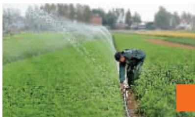
八卦洲的农户在田头为芦蒿浇水