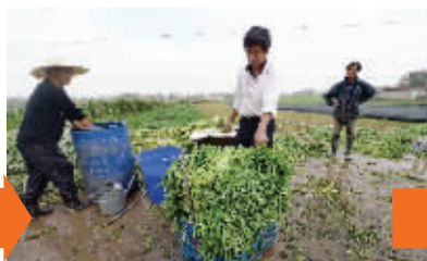
部分芦蒿已经收割