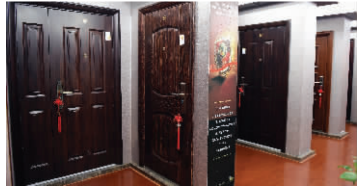
在南京卡子门附近,一家家具商场出售带有防火性能的防盗门

江宁区市场监督管理局对6家企业进行了立案查处,并通报给当地住建局和开发商,要求做好后续整改。