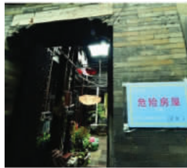
糖坊廊61号河房成危房 资料图片

糖坊廊61号河房是省级重点文物保护单位。从上世纪90年代起,沿河地便开始下沉,今年夏天现代快报记者探访时发现,楼顶塌出一个大窟窿,漏雨严重,再加上多处损毁严重,已经无法居住。昨天,记者从秦淮区双塘街道获悉,河房维修工程目前已完成招投标,最快从本月底开始大修,维修时间历时三个月。届时有望恢复当年精美的《三国演义》主题木雕。