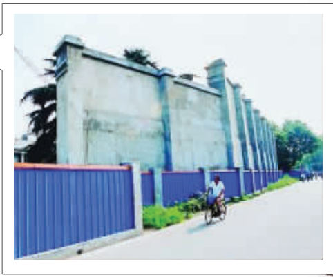
总统府大照壁 资料图片

此前大照壁是南京市人防部门拆下来的,之前有消息称是人防部门还要负责复建施工。但是市人防部门也表示不清楚此事。据一位知情人士透露,此前南京是有意恢复总统府大照壁的,2013年的规划内建议回归,也是为了预留地方,如果择机实施规划后,可以实行。不过,据说对于是否回归的争议较大,所以暂时停止了。