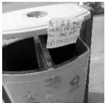
公交站台地图、街边垃圾桶、商场前的隔离球上都贴着小广告