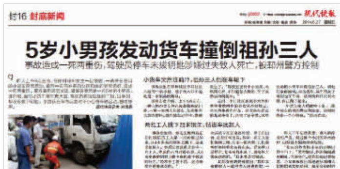
2014年6月27日现代快报曾报道