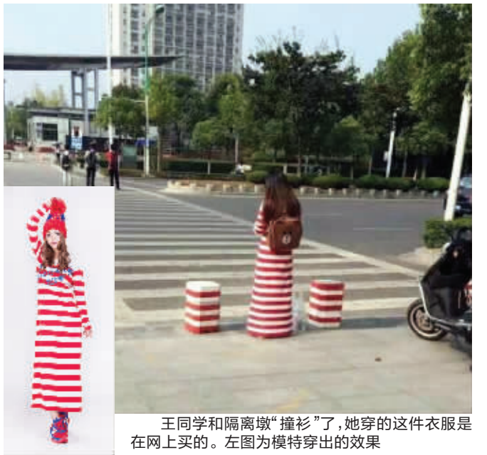
王同学和隔离墩“撞衫”了,她穿的这件衣服是在网上买的。左图为模特穿出的效果

最近,一张“隔离墩成精了!”的图片在微博上热传。图片上,一名身穿红白条纹长裙的女生站在路边,她的背影和脚边的三个隔离墩“融为一体”,远看像是长条的“隔离墩”。昨天下午,现代快报记者联系上了这个和隔离墩“撞衫”的女生,她是南京财经大学一名大四学生。 现代快报见习记者 蔡梦莹