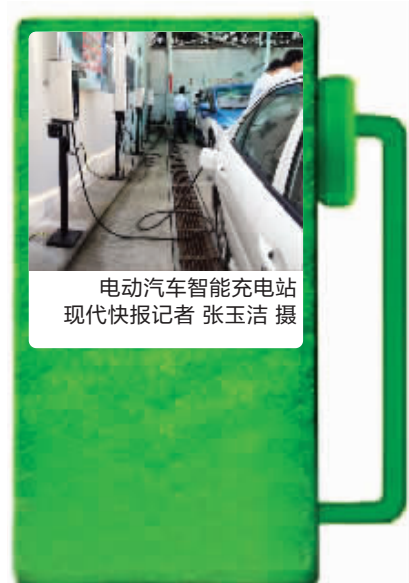
电动汽车智能充电站

上元门站开通后,地铁3号线往秣周东路方向,在此停靠的首班车时间为6点17分,末班车为23点17分;往林场方向,在此停靠的首班车时间为6点55分,末班车为23点55分。