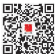
扫描二维码 加主持人微信