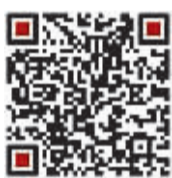
扫描二维码 关注微拍负责人