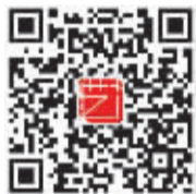
艺加文投 微信公众账号