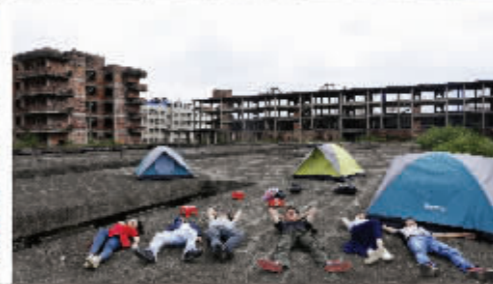
二打六小组《睡鬼城》