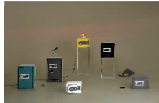
谢莉斯《密闭游戏保险箱》

道现实中这个艺术家是什么样,更不知道这个艺术家为什么要创作这样的作品。所以拍纪录片实际上是想拉近观众与作品的距离感。我认为纪录片最好看的地方是很多很多的原始素材,而不是正片。想象一下,在很多年后的某一天,我们拍过的艺术家变成了很牛的艺术家,又或者放弃了艺术,那么我们在今天保留下来的视频将是一笔非常珍贵的财富。