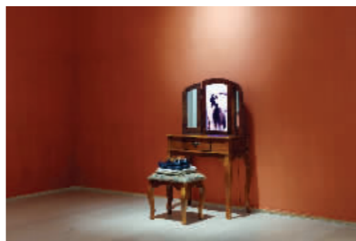
何倩彤《香港》《明天你会为我扎马尾》