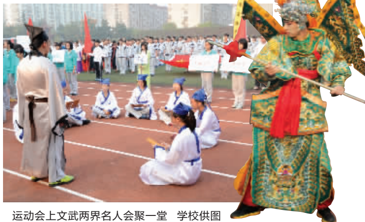
运动会上文武两界名人会聚一堂

记者了解到,除了运动会开幕式上的展示,孔子、霍元甲、黄飞鸿等文武名人也和同学们朝夕相伴。这位老师介绍,二十九中是江苏省普通高中儒学经典课程基地,建成了省内首个“儒学馆”。而且,武术也是二十九中的传统项目,“每天大课间学生都会参与武术操,体育课上可以选修武术课程,还有武术校本课程,形成了塔形课程体系”,让学生在训练中外强体魄、内塑灵魂。