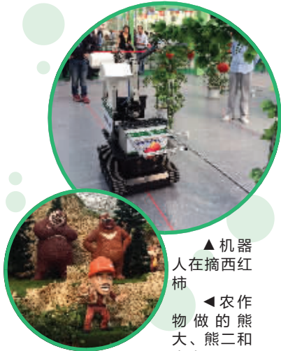
▲ 机器人在摘西红柿