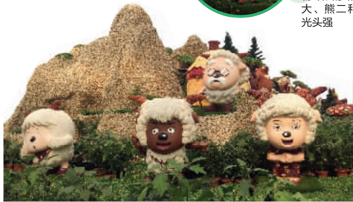
农作物做的喜羊羊和小伙伴们