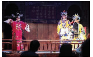
山西晋剧院在南博演出

快报讯(记者 胡玉梅)对于戏迷们来说,这绝对是一场戏曲大餐。为了让南京戏迷们听遍“南腔北调”,本月15日—明年2月15日,《南腔北调——中国传统戏曲艺术展》将在南京博物院上演,山西晋剧、陕西秦腔、豫剧、京剧、黄梅戏……一系列传统戏曲将轮番上演。