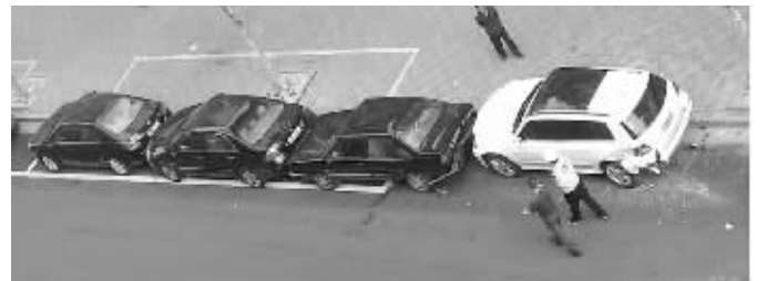
被撞坏的4辆车