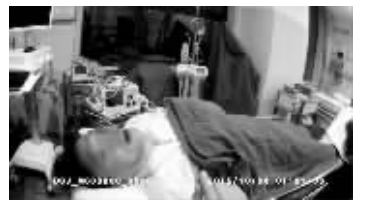
肇事司机随后被送进医院