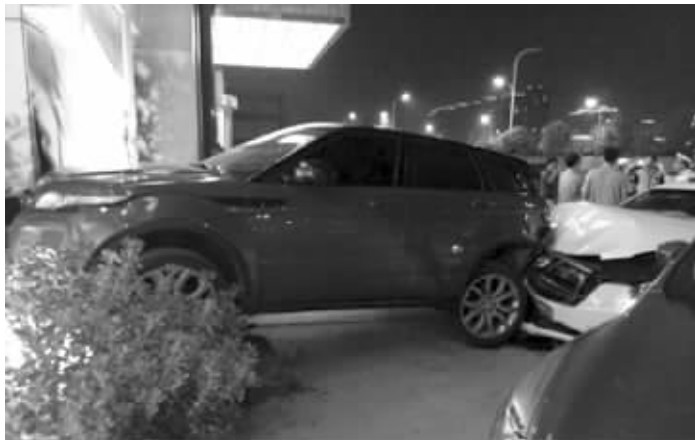
事故现场