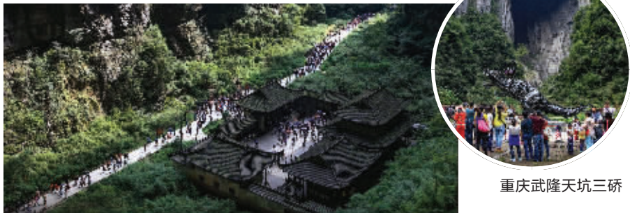
重庆武隆天坑三桥