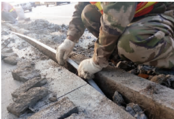
春江路一处公共自行车站点,工人已经在埋装有线路的塑料管