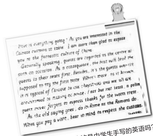
你能看出这是中学生手写的英语吗?

再次,不要有试水心态,不要有第一次考试只是去试试,走走流程的心理,每一场考试都应该认真对待,免得一次分数低,后面考好了反倒被官方怀疑。