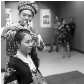
广西壮族梳妆展演