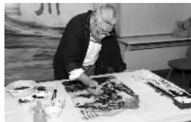
河海老教授创作书画作品

快报讯(通讯员 李婉婷 记者 俞月花)“虽然河海大学是工科大学,但是在课业生活之余练习书法绘画,即使成不了书画大师,对于调节心情、丰富业余生活也很有意义……”10月9日下午,河海大学20多名师生齐聚西康路校区,用书法、中国画、篆刻等文化艺术形式喜迎母校百年校庆。