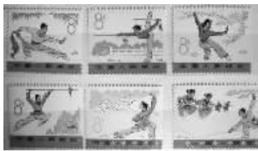
当年的邮票也很有特色 资料图