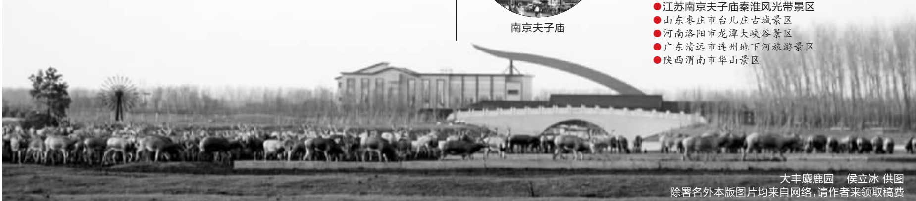
大丰麋鹿园 侯立冰 供图 除署名外本版图片均来自网络,请作者来领取稿费