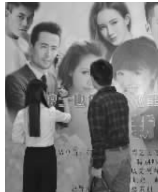
主创人员在发布会现场签名