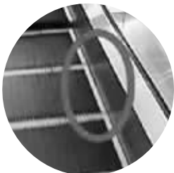
围裙板和梯级之间