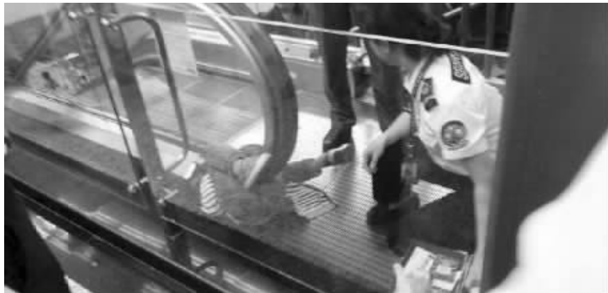
孩子被卡现场

记者了解到,目前轨道集团正配合公安、安监、质监等部门对事件进行调查,对死者家属进行安抚和慰问。轨道集团同时呼吁乘客,出行时一定要照顾好老人和小孩,以免发生意外。