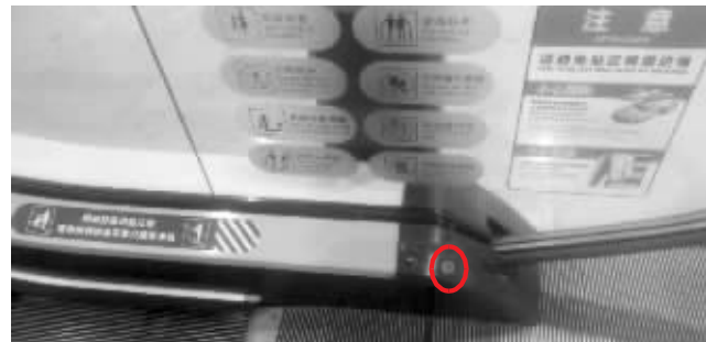
紧急制动按钮