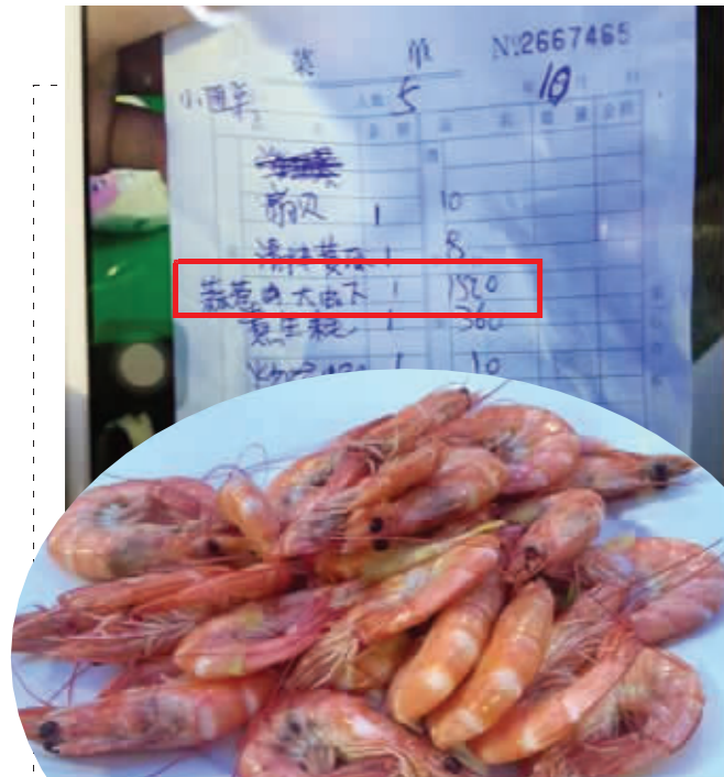
朱先生点了这样一盘虾, 被收1520元 网络图片, 请作者来认领稿费

青岛“天价虾” 10月4日晚, 南京游客李先生在青岛的“善德活海鲜烧烤”吃饭时遭遇宰客: 点菜时38元一份的“海捕大虾”, 结账时却变成38元一只, 一盘虾要价1520元。新华社昨日发文, 呼吁根除天价虾背后“三大顽疾”。现代快报记者 赵书伶 张瑜 综合新华社