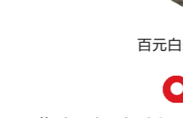
百元白米粥就是左边这样的大砂锅盛着的