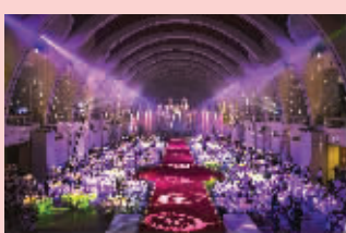
婚礼现场十分梦幻