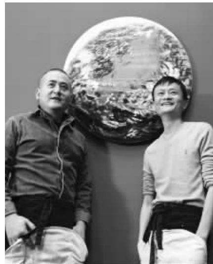
马云和曾梵志合作的油画《桃花源》

10月4日晚,在香港苏富比拍卖会上,马云和曾梵志合作的油画《桃花源》以130万港币起拍,经过32轮竞拍,历时7分15秒,被70后香港企业家、慈善家、环球国际(香港)控股集团董事长钱峰雷以3600万元港币拍下,最后成交价是起拍价的27.69倍。据悉,此次拍卖所得全部款项将捐赠给桃花源基金会,用于环境保护公益事业。