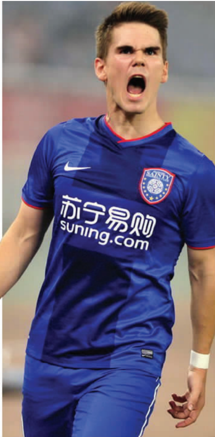
卡尔坦松为舜天打开胜利之门

就是凭借这样的血性, 舜天不仅在客场取得进球, 更是拿到一场胜利。球队内部一位人士赛后说: “完全没想到我们能在客场赢球, 如果最后时刻不丢那个球, 我们几乎进了决赛, 但即使2:1这样的比分, 也已经很好了, 我们也有信心在下回合主场比赛中保持这样的优势, 晋级决赛并最终拿到冠军!”