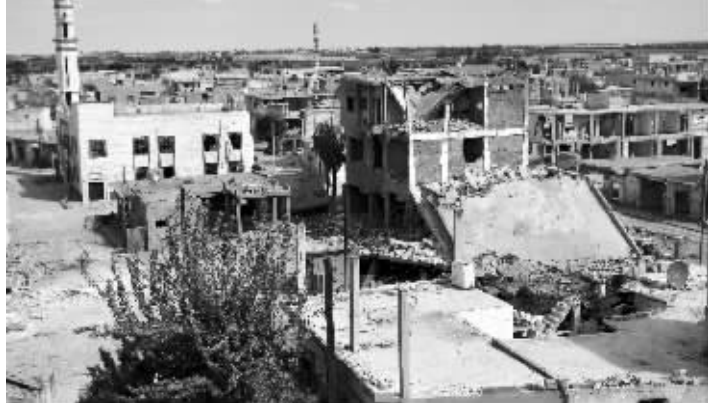
9月30日,叙利亚中部霍姆斯省的塔尔比塞赫镇街上空无一人,房屋被损毁。俄罗斯国防部9月30日证实,俄方当天已对叙利亚境内霍姆斯省“伊斯兰国”武装分子发动空袭

科纳申科夫援引俄国防部长绍伊古的话介绍说,俄方打击对象包括“伊斯兰国”拥有的军事装备、通