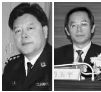
张家成(左)、肖玉平(右)资料图片

记者从辽宁省纪委获悉,辽宁省人大法制委员会主任委员(省司法厅原厅长、党组书记)张家成、中国医科大学副校长肖玉平两名厅官29日受到了开除党籍、开除公职的处分。两人涉嫌犯罪的问题被移送司法机关依法处理。