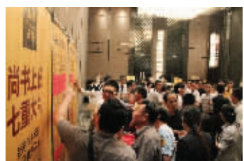
项目开盘现场人气火爆

在前一交易日基础上,沪深两市成交继续萎缩,分别为2314亿元和3192亿元,总量降至5500亿元附近。 据新华社