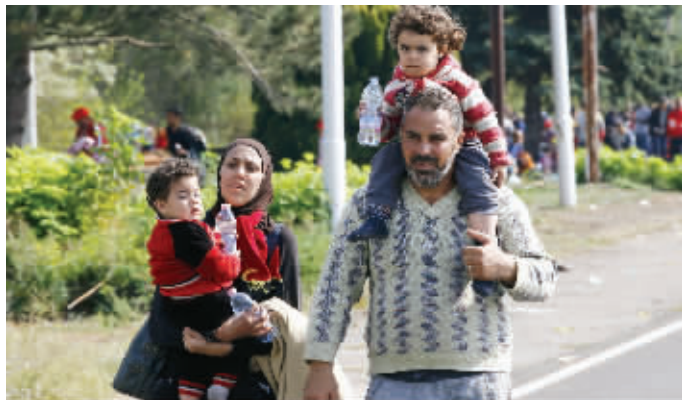
9月23日,在匈牙利海吉什豪洛姆,难民向匈牙利与奥地利边境走去

由于英国、爱尔兰、丹麦在转移安置难民问题上享有“退出权”,丹麦和英国将不参与这一计划,爱尔兰则表示了参与意愿。不过英国内政大臣特雷莎·梅表示,今后5年将直接接纳2万名来自叙利亚周边国家的难民。