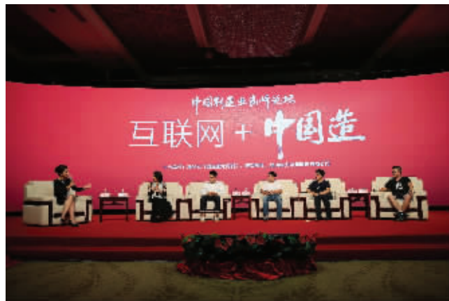
中国制造业高峰论坛现场