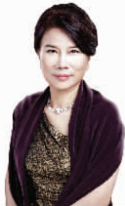
格力电器董事长 董明珠

9月22日,由新华社《财经国家周刊》、瞭望智库、珠海格力电器股份有限公司联合主办的中国制造业高峰论坛暨“中国品牌在行动”新闻发布会在珠海隆重召开。中国制造业企业的众多企业家们齐聚珠海,见证格力电器发布新的品牌口号——“格力,让世界爱上中国造”。见习记者 白相盼