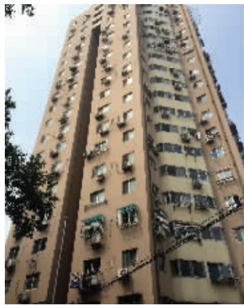
男子从这栋楼的19楼坠下

昨天上午10点半左右,南京市玄武区花园路78号小区里发生一起悲剧:一名60岁的男子从小区19楼坠下,当场身亡。而更加不幸的是,这名男子坠楼时,砸到了楼下路边的5旬大妈。由于坠楼时的冲击力巨大,大妈身受重伤,最终抢救无效身亡。现代快报记者 陶维洲 廖健伟