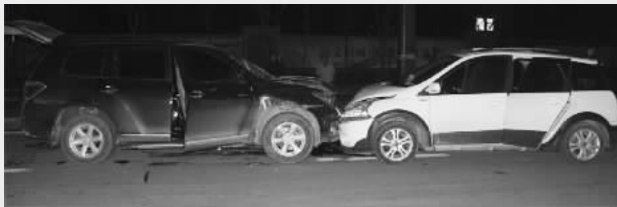
火并现场相撞之后的汽车

与此同时,连云港警方还相继开展以红缨枪、砍刀等管制器具为重点的社会危险物品大清缴专项行动,以娱乐服务场所整治为重点的打黄打非和查缉毒品专项行动,以重点地区挂牌整治为重点的治安整治专项行动等,全力挤压黑恶势力活动空间,铲除黑恶问题滋生的土壤。今年上半年,连云港辖区内的涉黑涉恶类案件同比下降21.3%,有力维护了社会稳定。