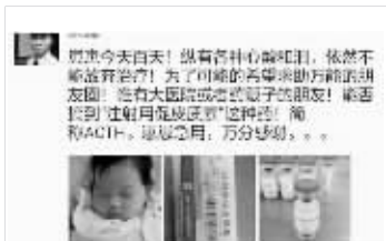
有网友在朋友圈急求ACTH

注射用促皮质素,简称ACTH,在几年前,它其实并没有这么火。根据解放军八一医院药剂科主任周永刚介绍,它是一种激素,适应症为活动性风湿病、类风湿性关节炎、红斑性狼疮等胶原性疾病,由于同类的替代药物很多,因此过去并不受到重视,医院本身也进货量不多。