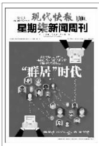
(上期星期柒新闻周刊封面)