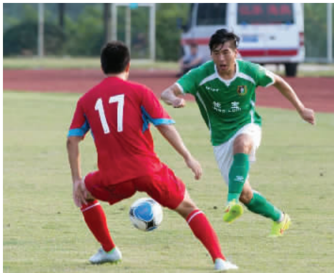
钱宝主场惨败,冲超梦想几乎破灭

在另一场半决赛中,大连超越客场0:0逼平四川鑫海达,半决赛第二回合的比赛将于9月26日举行。现代快报记者 王卫