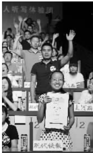
《现代快报》队又获冠军