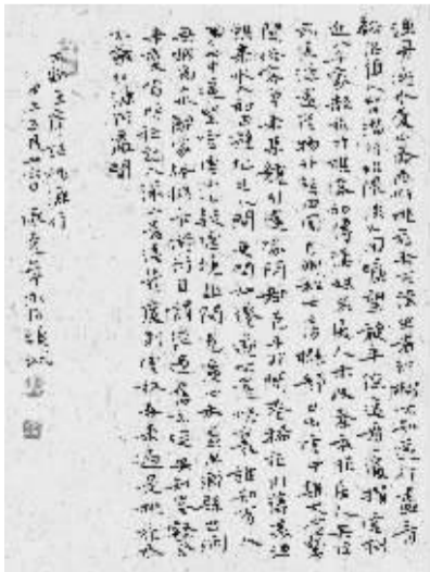
本版书法均为陈克年作品

诗书画印养精神!这是他自己的一句诗,是情怀,更是一种境!高情远致,逸笔文心,克年的未来将有着别样的意义!