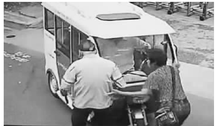
监控显示,事发瞬间,电动车碰到了老人

快报讯(记者 王益)从上周开始,“大学生扶老人反被讹”的新闻就占据了网络各大热搜榜,由于缺少监控,真相至今没有浮出水面。昨天上午8点多,在南京鼓楼区一小区外,一位老太太摔倒在地,尽管有两位路人扶起了她,但老人为何摔倒却成了谜,幸好,一旁的监控记录下了事情的经过,还原了真相。