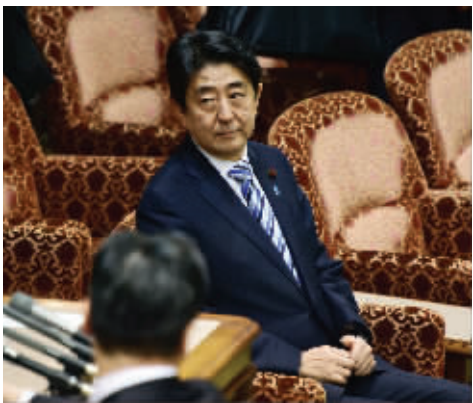
16日夜,参议院里的日本首相安倍晋三,安静旁观斗成一团的议员们