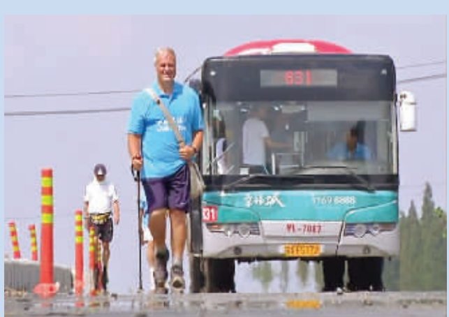
贝茨勋爵在南京六合境内行走