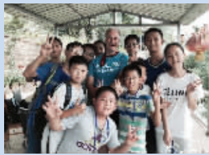
徒步第21天和参加夏令营的孩子们合影