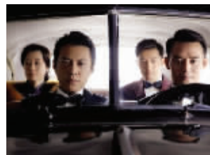
明家四兄妹颜值高,演技棒

以往提到抗战题材电视剧,观众往往不会把它们与高颜值画等号。不过在《伪装者》中,这个定律得到了颠覆。胡