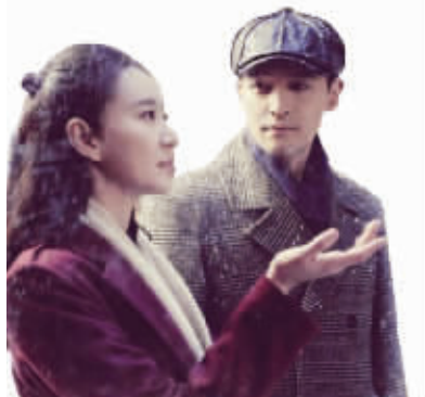
感情戏吸引了不少女性观众

作为一部纪念反法西斯胜利70周年的献礼作品,《伪装者》不仅从一众抗日剧中突出重围,还顺势击败了扎堆的青春偶像剧与传奇古装剧,一扫之前谍战剧类型收视低迷、受众面狭窄的种种阴霾景象,唤回了谍战剧迷们久违已久的热情和期待。