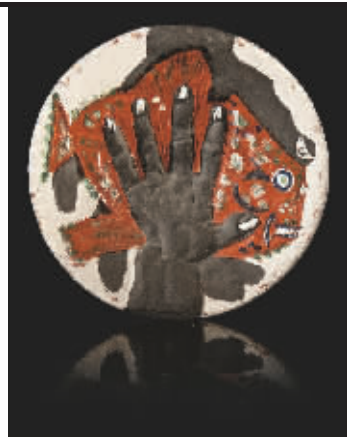
毕加索《摸鱼的手》(瓷盘)