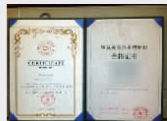
记者卧底美容培训机构,发现乱象重重,几天就能拿合格证