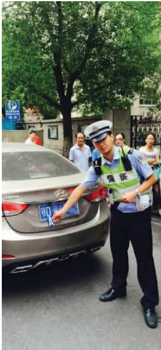
交警查处车辆变造号牌 通讯员供图