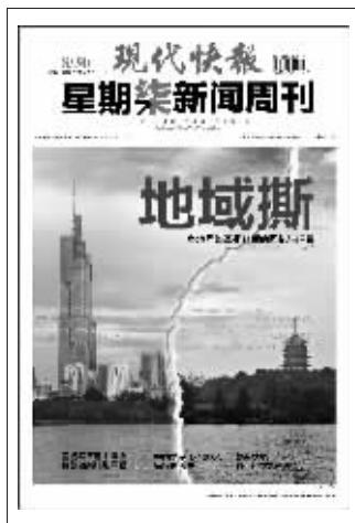
(上期星期柒新闻周刊封面)