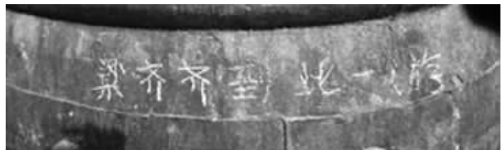
“梁齐到此一游”字样