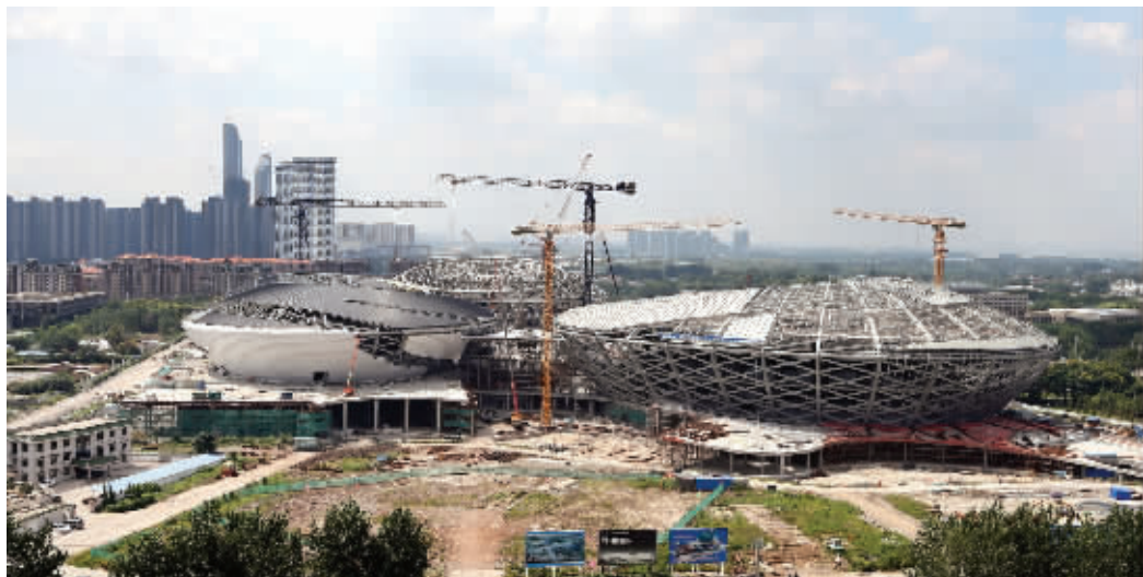
在建中的江苏大剧院